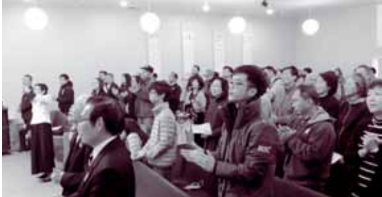
柏克萊台福30週年慶