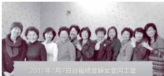
為全年方向定調的聚會

1月9日是婦女會今年第一次的聚會，通常新年第一次聚會有一個作用，就是為整年的方向定位。依照慣例，聚會一開始先由幾位姊妹帶領大