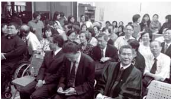
林口台福晉升福音站